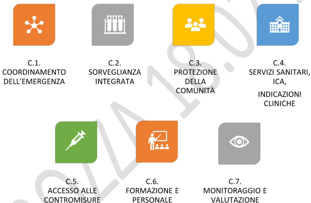
Figura 2. Sistemi e capacità per la preparazione e la risposta

Nella sezione "D. Fasi operative, segnali e valutazione del rischio" viene descritto l'approccio metodologico operativo per la gestione delle allerte internazionali e nazionali, la valutazione del rischio, i principali parametri per l'interpretazione epidemiologica della pandemia e la valutazione del rischio, la descrizione delle fasi operative e la metodologia per definire il passaggio tra le fasi operative.